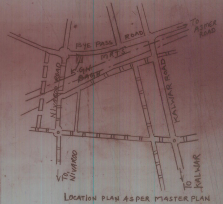
LOCATION PLAN AS PER MASTER PLAN / SECTOR PLAN