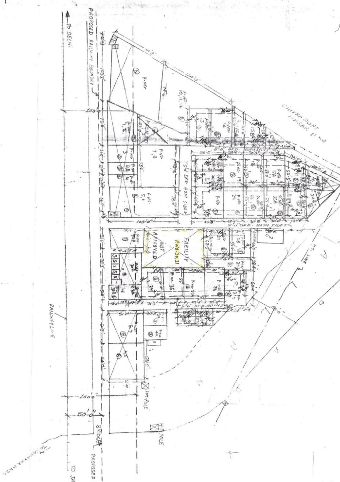
LOCATION PLAN AS PER MASTER PLAN/SECTOR PLAN